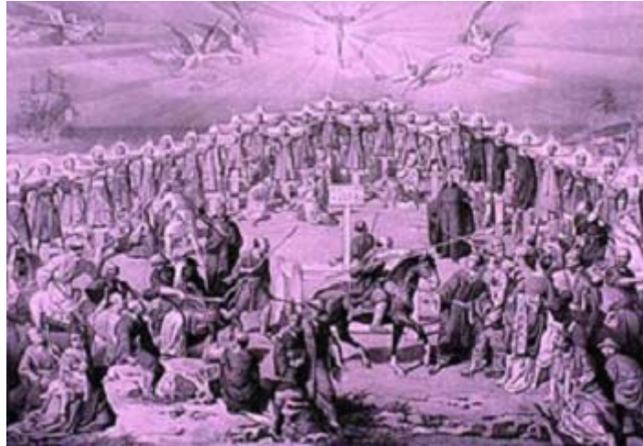
キリスト教殉教者ペドロ・パウティスタとパウロ三木の処刑。

処刑のために指定されたのは、街を見下ろす丘で、十字架が並んでいた。隊長の合図とともに、26人は十字架に掲げられた。十字架が上がっていく間に、キリストの証人たちの声が響き始めた。神への感謝の『テ・デウム』を口にしながら、死の扉に近づいていくのだった。何世紀も後この同じ谷間で、原子爆弾が炸裂した後、さらにひどい残酷さが轟くのだった。