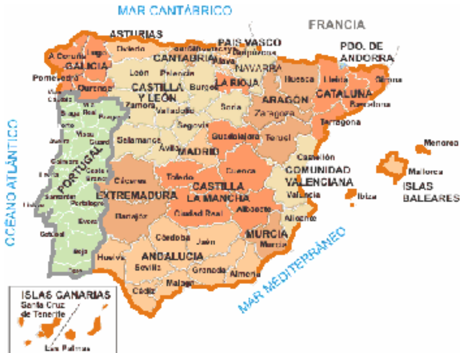
Spain & Portugal today.