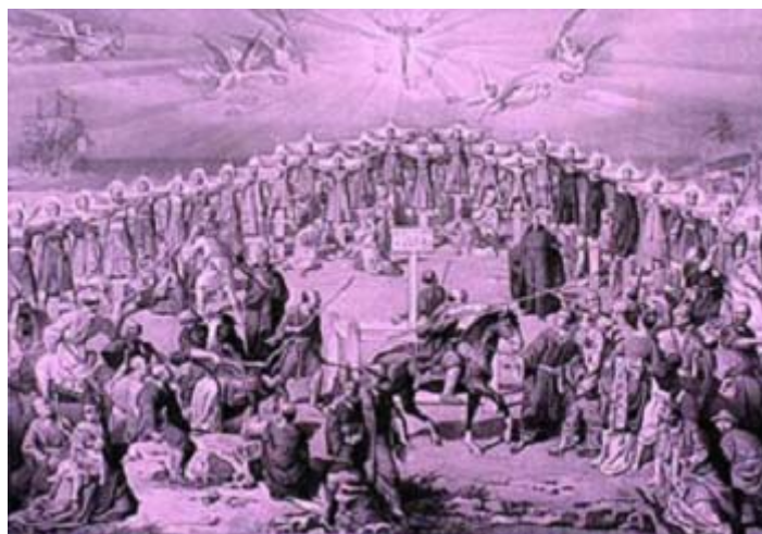
Ejecución de los 26 mártires. Grabado de Nishizaka-machi en el relicario conservado en Nagasaki.

Un lugar en la colina frente a la ciudad fue señalado para la ejecución y las cruces enfiladas. A la señal del capitán las veintiséis fueron izadas y, mientras ascendían, empezaron a resonar las voces de los testigos de Cristo que se acercaban a las puertas de la muerte con un Te Deum de acción de gracias. Estaban en el mismo valle en que siglos después una crueldad aún más atroz retumbó tras la explosión de la bomba atómica.