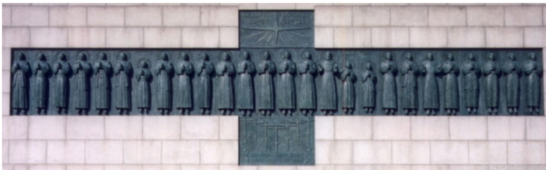
Monumento construido a los 26 mártires por Yasutake Tumakoshi en 1962.

Era 5 de febrero de 1597. El calendario franciscano pone como cabeza del grupo a San Pedro Bautista, el de la iglesia universal al japonés San Pablo Miki. Hombres de dos mundos crucificados juntos por el mismo ideal.