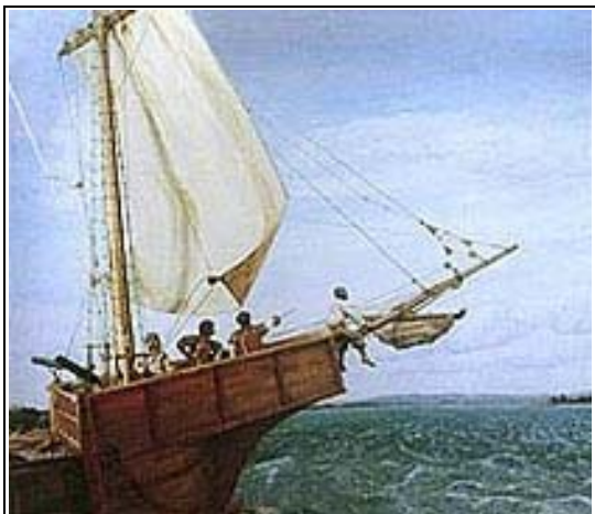
Ilustración del viaje de Pedro Bautista. José Toribio Medina, 1898.

Puede que el miedo a estropear el frecuente y productivo comercio con españoles y portugueses, tuviese algo que ver con esta conducta.