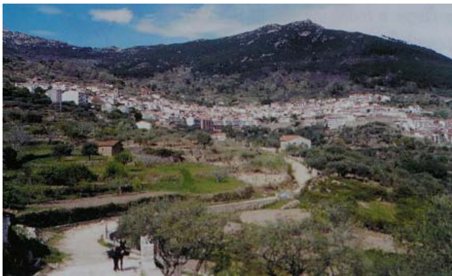
Vista de Pedro Bernardo, localidad española en la Sierra de Gredos (Ávila).

Esta es la historia de un encuentro, el primero entre españoles y japoneses, y también la de Pedro Bautista un idealista, soñador, al que el Rey Felipe II designó primer embajador entre nuestros países, y que seguramente no por casualidad era natural de San Esteban del Valle, pueblo muy cercano y en la misma sierra que Pedro Bernardo, lugar en el que cada año organizamos el Gashuku Geiko y del que proceden mis antepasados.