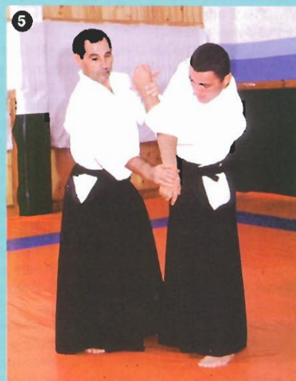
... ajuste de la técnica...