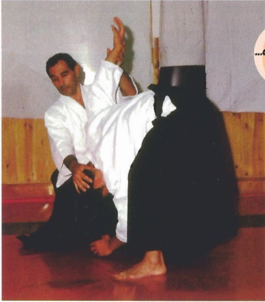
...desequilibrio de Uke.